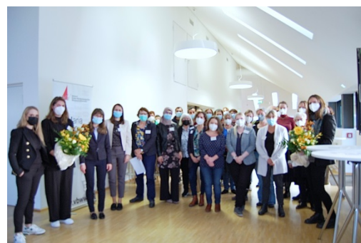
Gruppenfoto: Referentinnen und Teilnehmende des Symposiums am KIT